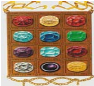
een reconstructie van het borstschild van de Hogepriester

Robijn symboliseerde het bloed van Christus, emerald zou vrede en geluk brengen en de diamant was symbool van trouw aan Christus en God. Hiermee begon ook de populariteit van de trouwringen die gemaakt waren van diamanten.